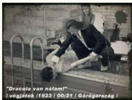
"Dracula van nálam!" | végjáték | 1923 | 00:21 | Görögország |